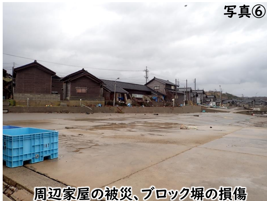
周辺家屋の被災、ブロック塀の損傷