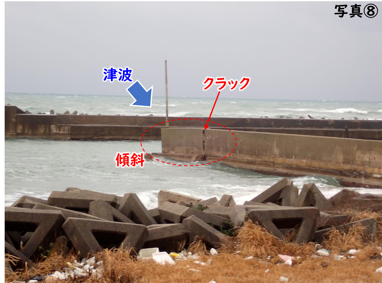
防波堤の先端に軽微な損傷 (傾斜、クラック) が見られる

漁港の全景 (動画、山栗先生撮影) https://youtu.be/H9ES525SY58