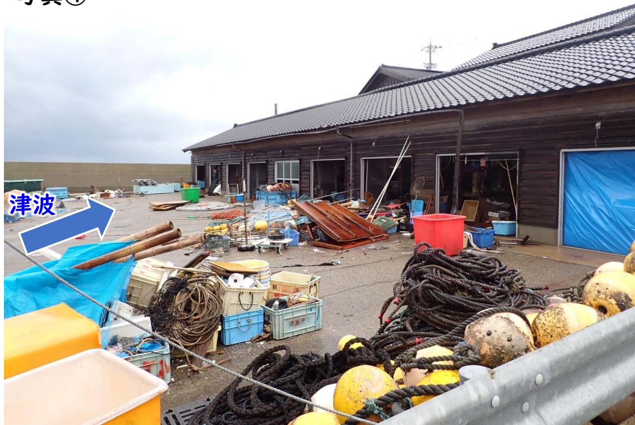
津波によって多くの漁業用品が散乱