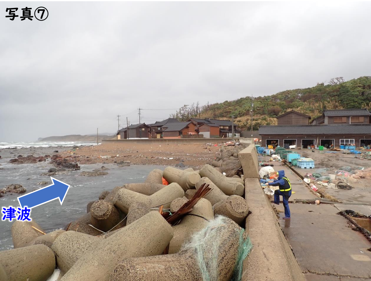
防波堤・波返し の状況 (顕著な被災なし)

海岸沿いの建物の痕跡から高さ2m以上の津波が陸上に到達した想定される。防波堤の一部にクラック・傾斜が見られる(注: 今回の津波で生じた損傷か不明)が、多くは健全であり、基礎マウントの洗掘・支持力破壊等は生じていないと推定される。この防波堤が有効に機能し、津波外力をかなり減じたと考えられる。