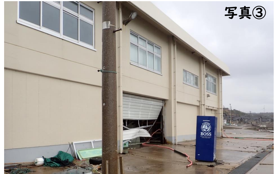
事務所の被害 (シャッターの破壊、自動販売機の水平移動)