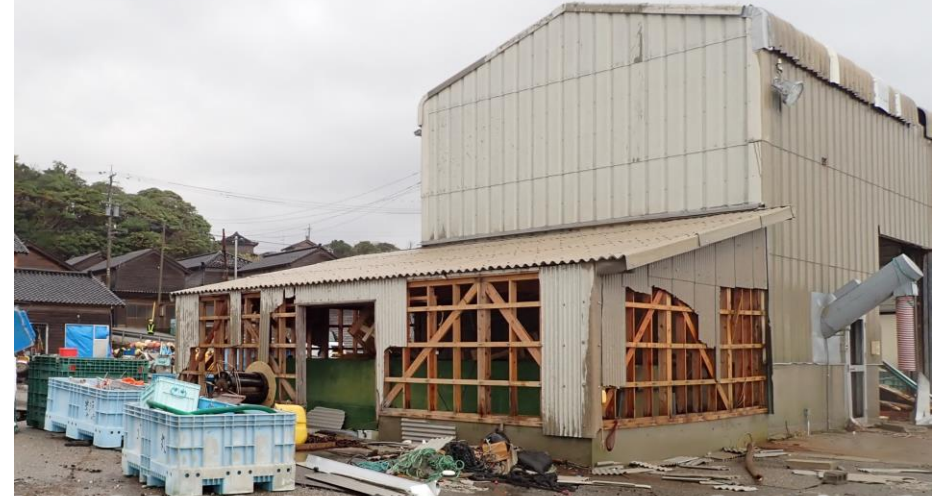
建物被害 (津波は高さ2~2.5m程度まで到達か)